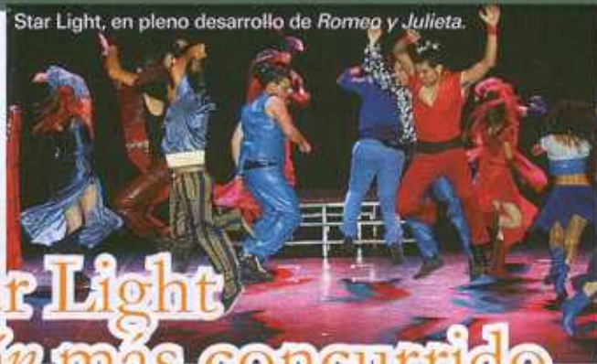
Star Light, en pleno desarrollo de Romeo y Julieta.

Star Light, que interpretó una versión del clásico de Shakespeare Romeo y Julieta , ganó el premio a la mejor compañía en la Muestra de Teatro Aficionado El Moscardón . El reconocimiento a su montaje —el mejor entre los ocho seleccionados e interpretados, de la veintena presentada a concurso— iba acompañado de una ayuda económica de 1.200 euros y un galardón conmemorativo elaborado por el Colectivo de Artistas Plásticos de San Fernando. Star Light, formación aficionada local, fue la mejor según un jurado compuesto por miembros de la Asociación de Vecinos Parque Henares, la Asociación de Vecinos Jarama, la Asociación de Mujeres Montserrat Roig, la Asociación Cultural Paulo Freire, la Casa de Andalucía y