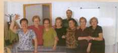
La formación Alfa-Día también participó con éxito en El Moscardón .

Los ocho montajes y la gala de entrega de premios se representaron y celebró, respectivamente, en el Teatro García Lorca.